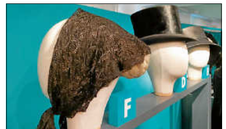
Trauer-Kopfbedeckungen um 1900

tenhemd & Leichenschmaus“, an der sie mitgewirkt hat. Aufgrund der Corona-Notbremse kann die Ausstellung momentan nicht besucht werden.