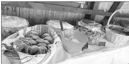
eine kleine Auswahl