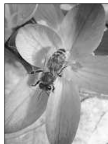
Wie lange summt und brummt es noch in der Blumenwiese?

Auf unseren Antrag hin trat Ditzingen dieses Jahr dem Landschaftserhaltungsverband (LEV) bei. Ein guter und wichtiger Schritt zum Erhalt der