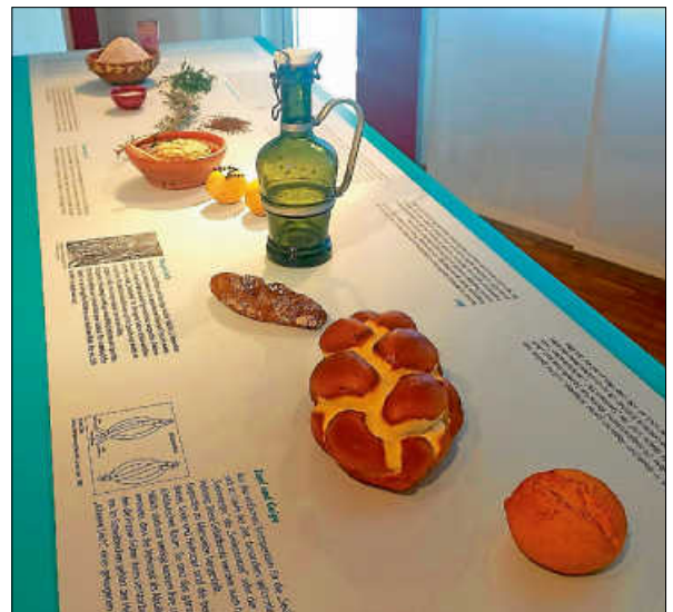
Der Hefezopf: traditioneller Bestandteil des schwäbischen Leichenschmauses

Was läuft aktuell? Was kommt als Nächstes? Momentan finden Dreharbeiten für einen Imagefilm über das Museum statt. Außerdem ist der Abbau angelaufen, um der nächsten Sonderausstellung Platz zu machen: „Was ist schön? Weibliche Schönheitsideale im Wandel der Zeit“ (26. Mai bis 26. Sept. 2021).